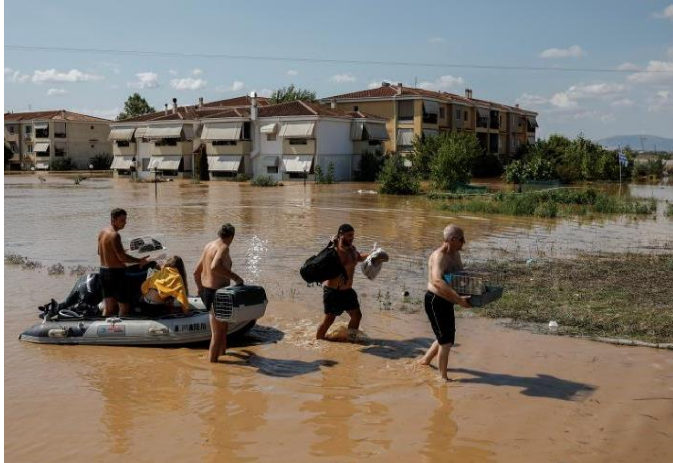
Les inondations en Grèce qui ont ravagé la région de Thessalie