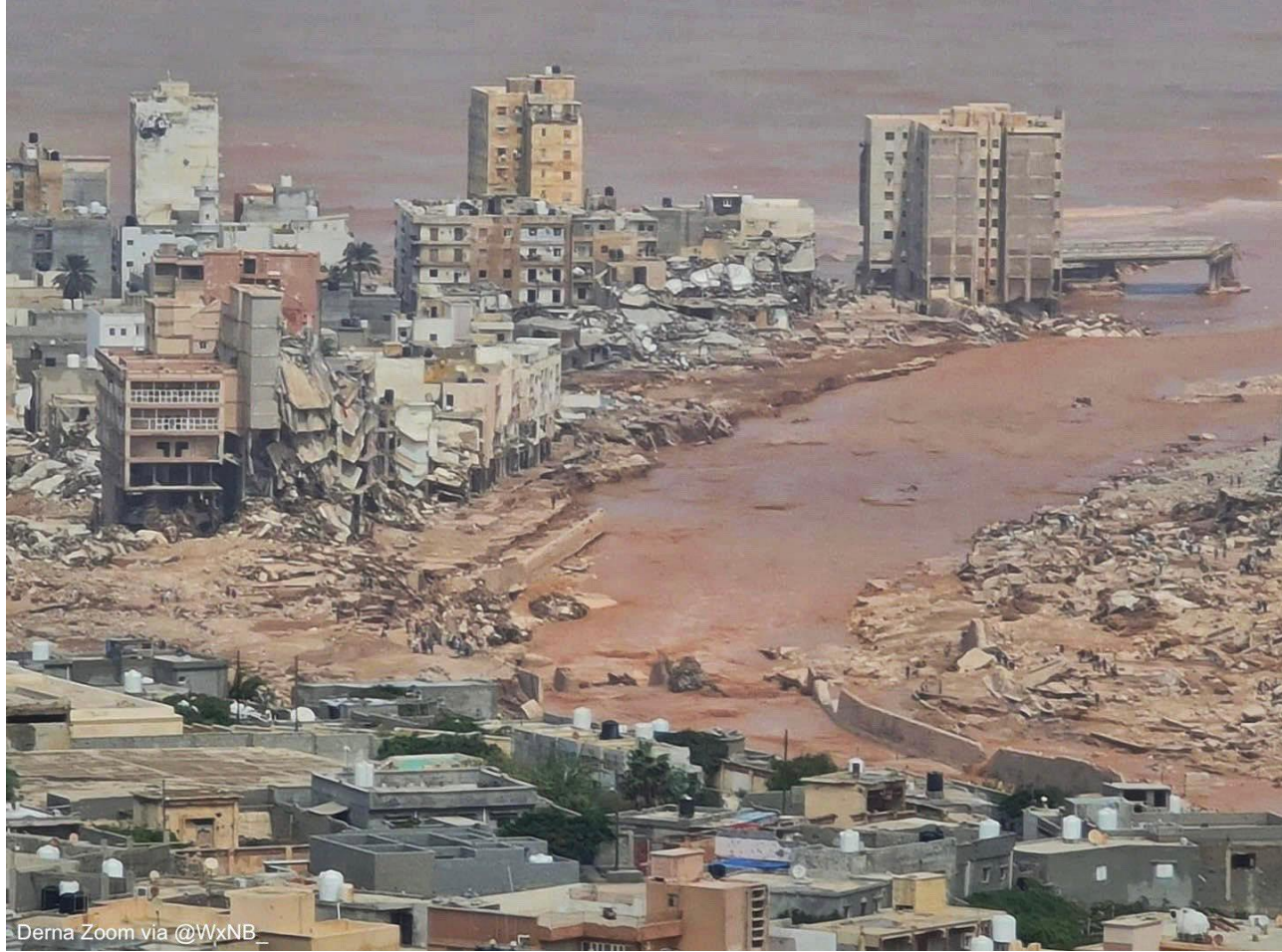
Derna Zoom via @WxNB